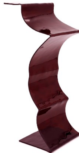
Cariatide 2 , 2024 Verre cintré 36 x 13 x 16 cm 900 euros