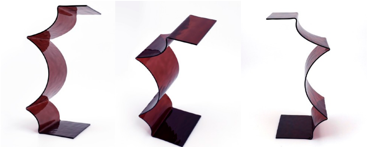
Cariatide 1 , 2024 Verre cintré 33,8 x 15 x 17 cm 800 euros