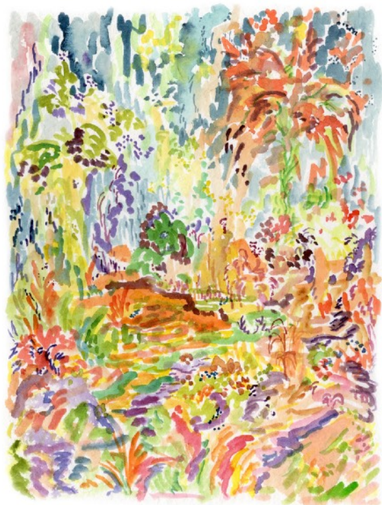
Marécage, 2022 Aquarelle sur papier 24 x 32 cm 240 euros