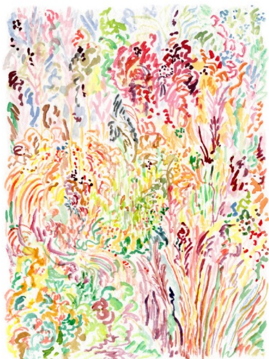
Un souvenir d'automne, 2022