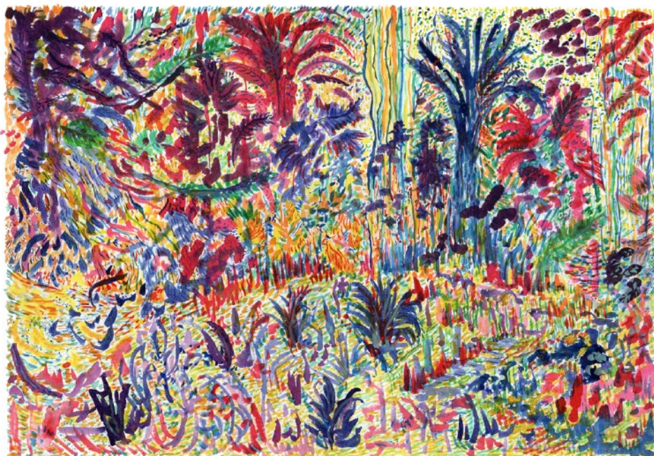
Le Marais, 2021 Aquarelle sur papier 36 x 51 cm 420 euros