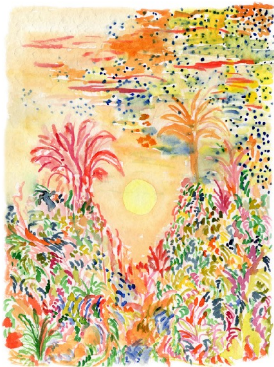
Avant la nuit, 2022 Aquarelle sur papier 24 x 32 cm 250 euros