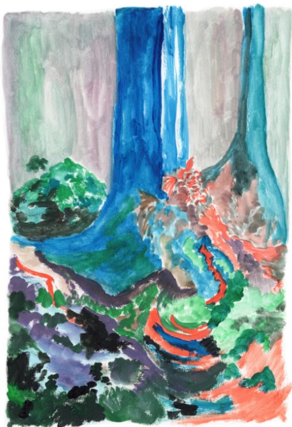
L'arbre bleu, 2022 Gouache sur papier 29,7 x 42 cm 300 euros