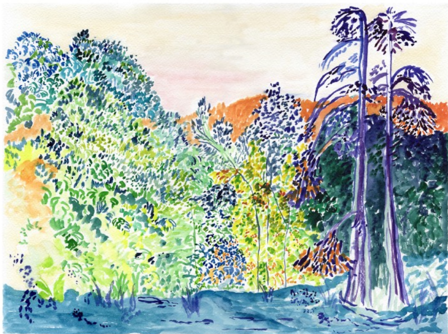
Paysage du soir , 2021 Aquarelle sur papier 42 x 29,7 cm 400 euros