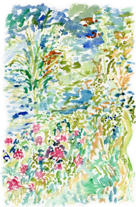
Depuis la mer , 2023 Aquarelle sur papier 18 x 26 cm 170 euros