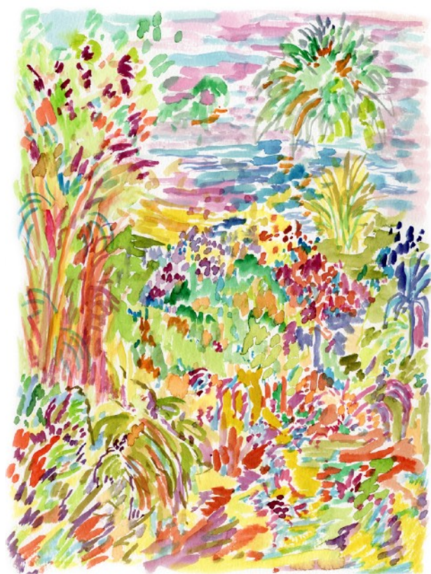
Jardin d'Orient , 2022 Aquarelle sur papier 24 x 32 cm 240 euros