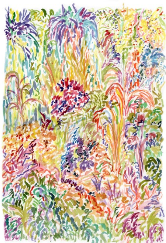
Forêt sauvage , 2022 Aquarelle sur papier 29,7 x 42 cm 340 euros