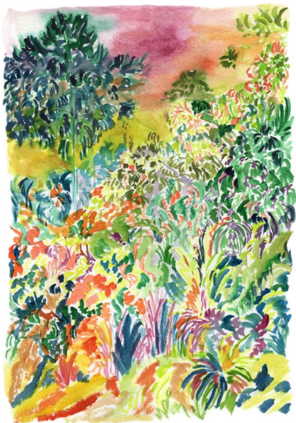
Végétation , 2022 Aquarelle sur papier 36 x 51 cm 550 euros