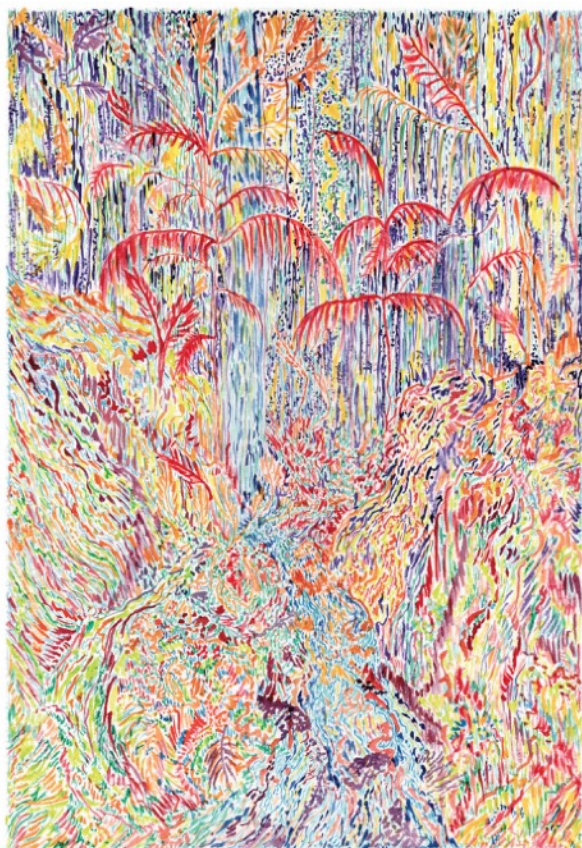
Les palmiers du paradis , 2021 Aquarelle sur papier 36 x 51 cm 650 euros