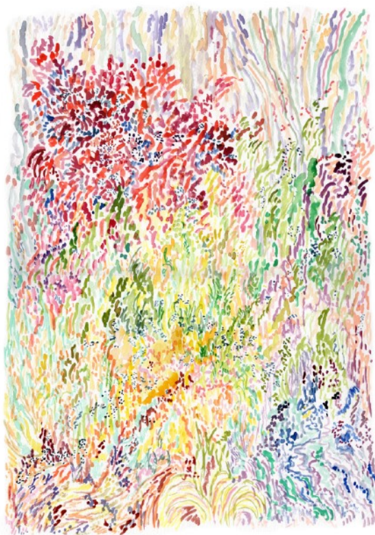
Cocon , 2022 Aquarelle sur papier 29,7 x 42 cm 340 euros