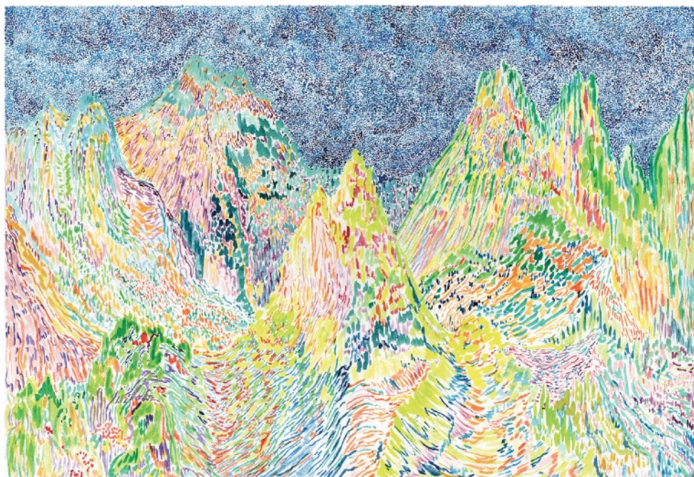
Bientôt l'orage , 2021 Aquarelle sur papier 51 x 36 cm 650 euros