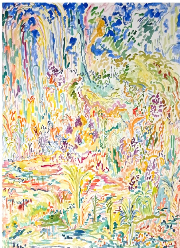
Les enchantements, 2023 Aquarelle sur papier 56 x 76 cm 1250 euros