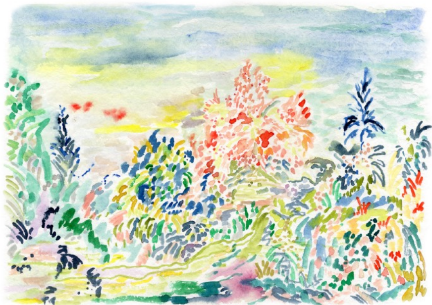
Matinée, 2022 Aquarelle sur papier 24 x 32 cm 240 euros