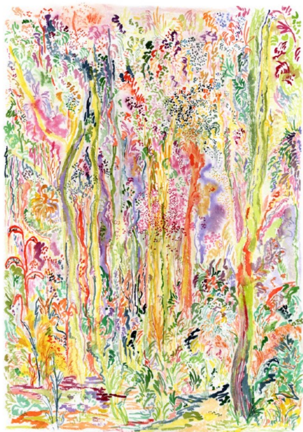
Les survivants, 2022 Aquarelle sur papier 36 x 51 cm 550 euros