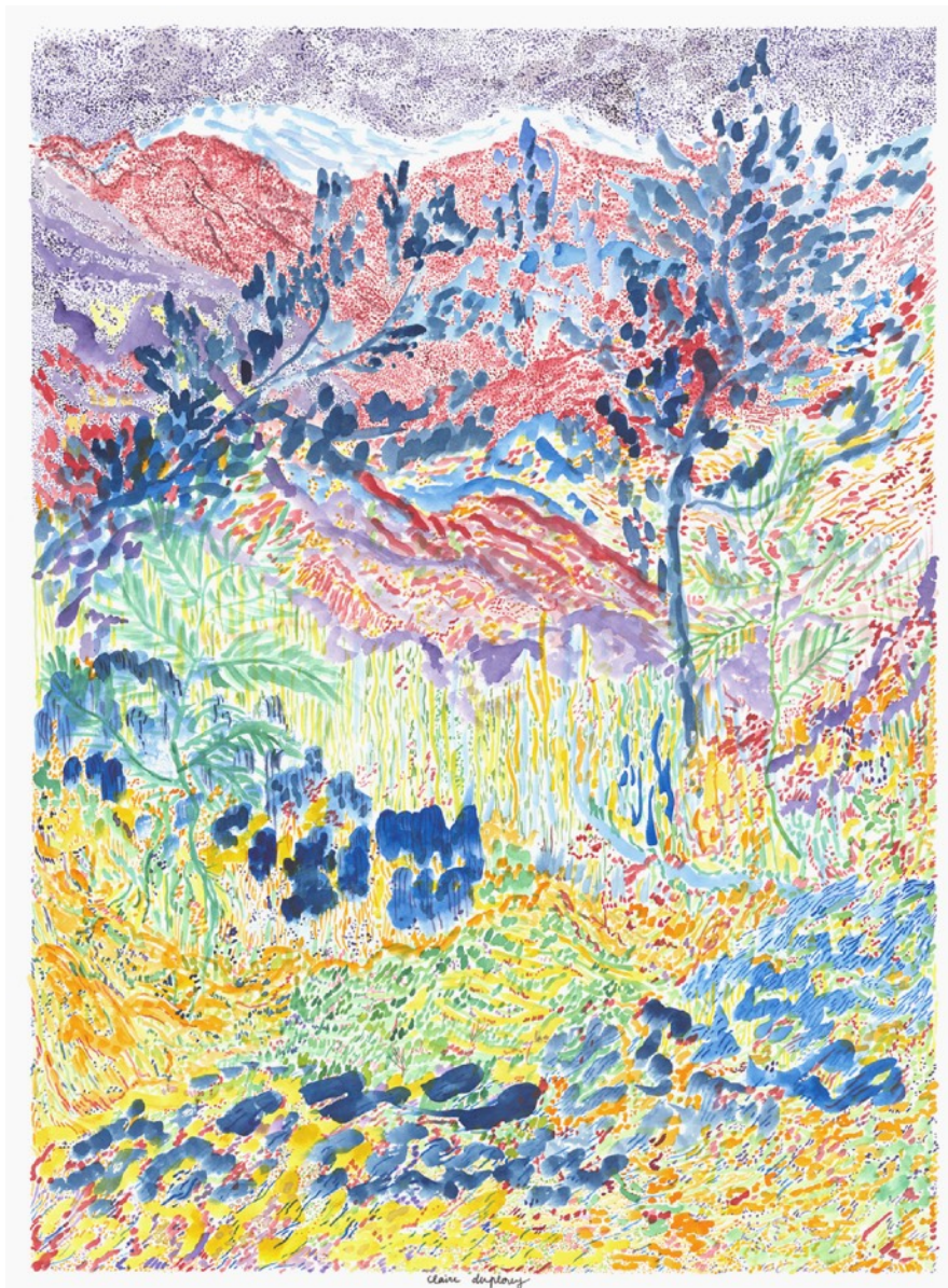
Les 4 saisons , 2021 Aquarelle sur papier 56 x 76 cm 1500 euros