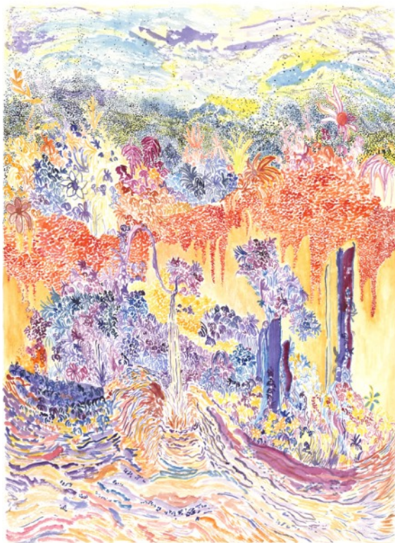
Jardin exquis, 2021 Aquarelle sur papier 56 x 76 cm 1000 euros