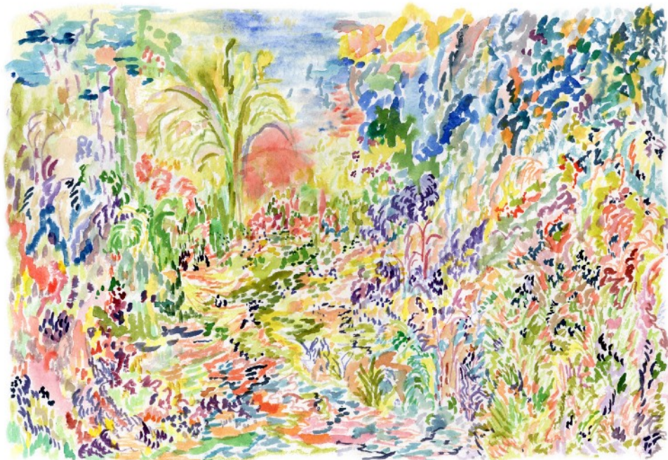
Revoir la lumière, 2023 Aquarelle sur papier 36 x 51 cm 420 euros