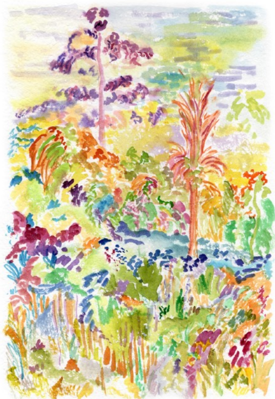
Jardin du Sud, 2022 Aquarelle sur papier 36 x 51 cm 500 euros