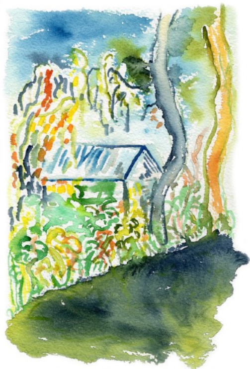
Balade à Pont-Aven, 2023