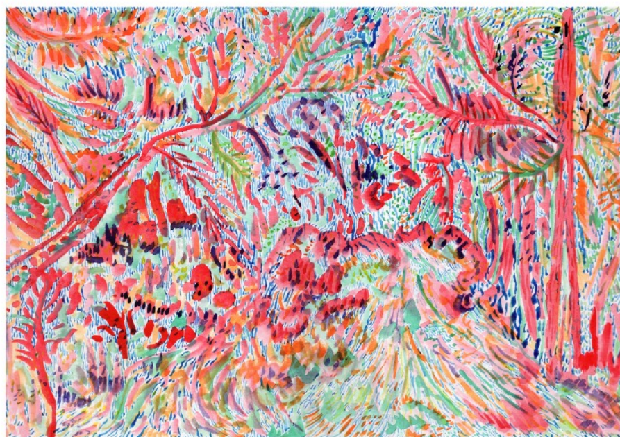
Les pleurs éternels de la forêt, 2020 Aquarelle sur papier 42 x 29,7 cm 300 euros