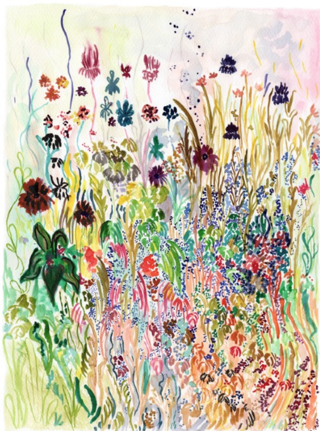
Suzie's Garden, 2021 Aquarelle sur papier 30 x 40 cm 300 euros