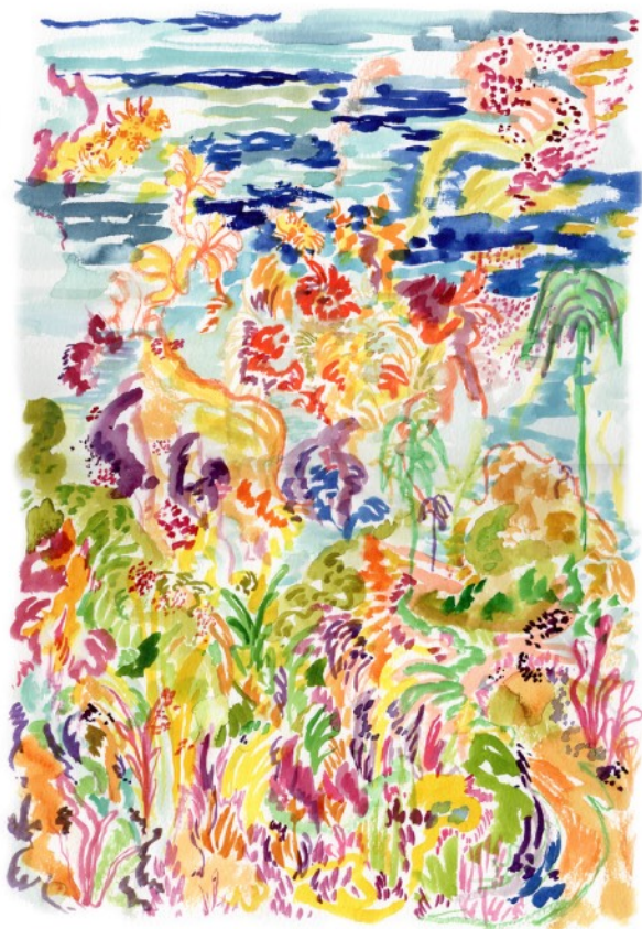
Summer Day, 2022 Aquarelle sur papier 29,7 x 42 cm 300 euros