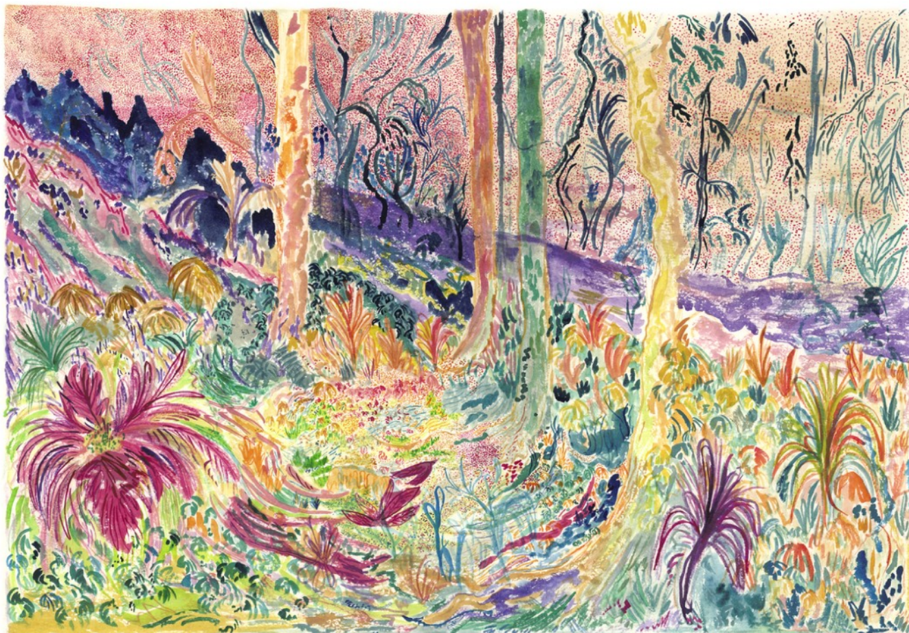
Passiflore , 2021 Aquarelle sur papier 105 x 75 cm 2000 euros