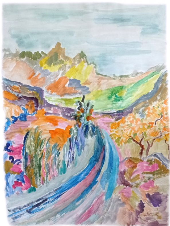
Plaine , 2022 Aquarelle sur papier 50 x 65 cm 650 euros