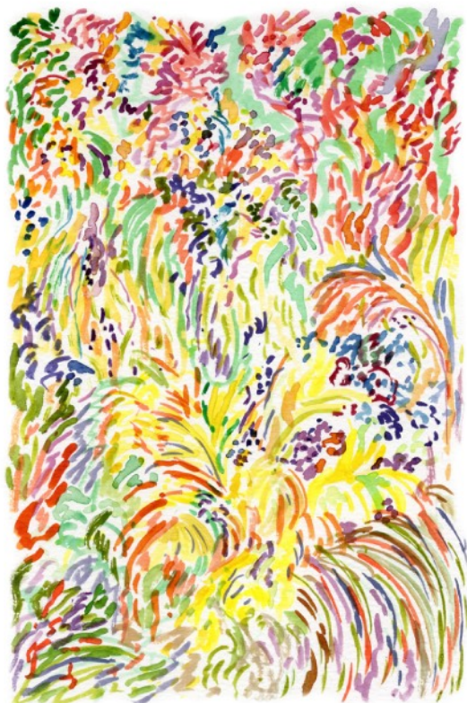
S'épanouir , 2022 Aquarelle sur papier 14,8 x 21 cm 100 euros