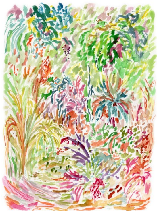
A côté de l'étang , 2022 Aquarelle sur papier 24 x 32 cm 240 euros