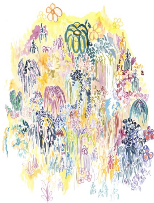
Mellifères , 2021 Aquarelle sur papier 50 x 65 cm 550 euros