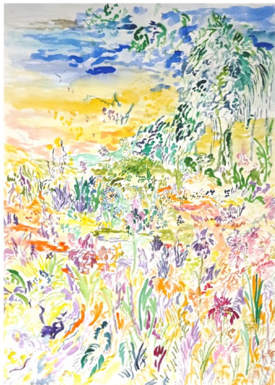
La vallée des iris, 2023 Aquarelle sur papier 56 x 76 cm 840 euros