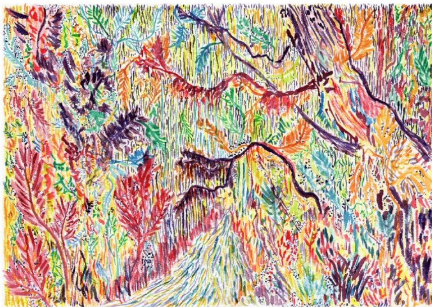
La forêt de lianes, 2020 Aquarelle sur papier 36 x 26 cm 300 euros