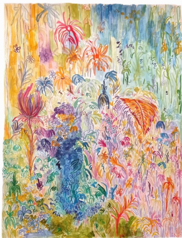
Tendres fleurs , 2021 Aquarelle sur papier 50 x 65 cm 500 euros