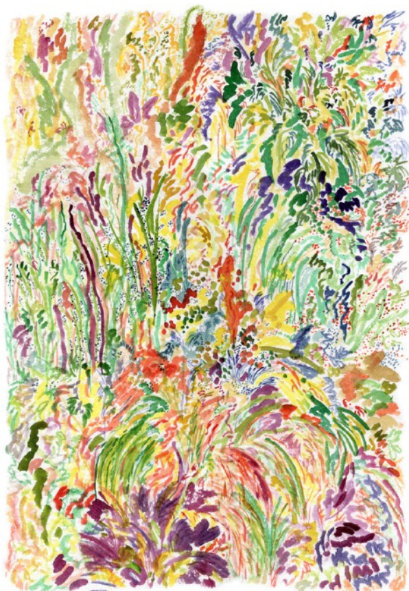
Les vivaces, 2022 Aquarelle sur papier 36 x 51 cm 550 euros