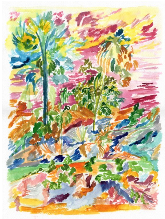
Désert, 2022 Aquarelle sur papier 30 x 40 cm 290 euros