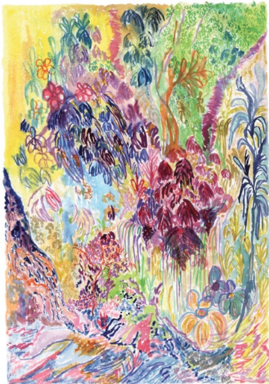
Des fleurs pour mes entrailles, 2022 Aquarelle sur papier 36 x 51 cm 420 euros