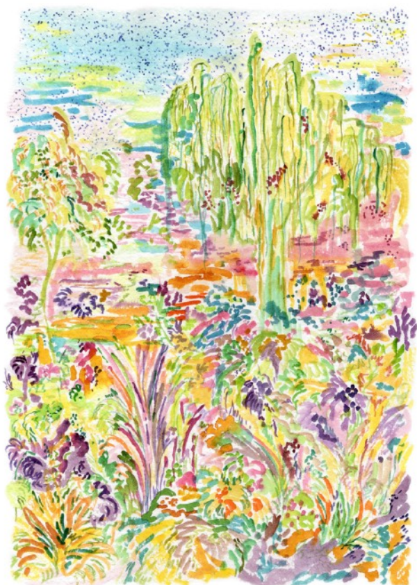
Saule pleureur , 2022 Aquarelle sur papier 36 x 51 cm 420 euros