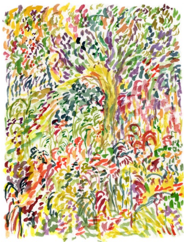
L'arbre ciel, 2022 Aquarelle sur papier 24 x 32 cm 250 euros